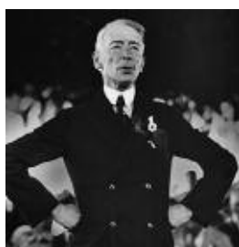
Louis-Alexandre Taschereau (1867-1952), 14e premier ministre du Québec.