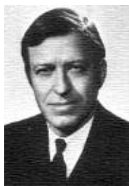
Gilles Lamontagne, ancien militaire, lieutenant-gouverneur du Québec et maire de la ville de Québec.

Plus près de nous, retenons Gilles Lamontagne, ancien lieutenant-gouverneur, ancien ministre canadien, ancien maire de Québec et ancien colonel. En 1943, il pilote son avion de la Force aérienne canadienne (RCAF) qui est abattu au-dessus de la Hollande. Il réussit à le maîtriser suffisamment pour que son équipage puisse sauter en parachute, mais il est fait prisonnier