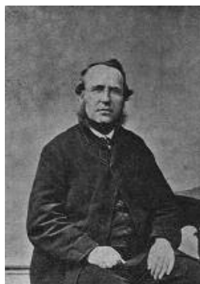
Joseph-Charles Taché (1820-1894), écrivain, homme politique, journaliste et médecin.

Le premier Québécois à être décoré de la Légion d'honneur le fut en 1855. Il s'agit de Joseph-Charles Taché, député à Québec, cofondateur de la Société Saint-Jean-Baptiste de Québec en 1842 et de la Société canadienne d'études littéraires et scientifiques en 1845. Il représenta la colonie comme commissaire à l'Exposition universelle de Paris en 1855. C'est à cette occasion qu'il reçut les insignes de chevalier de la Légion d'honneur de nul autre que Napoléon III.