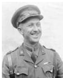
Georges Vanier (1888-1967), 19e gouverneur général du Canada.

C'est quelquefois à l'occasion d'événements marquants que la France remet la Légion d'honneur. Les deux grandes guerres mondiales qui ont donné naissance à plusieurs héros en sont un bel exemple. En signe de reconnaissance pour leur généreuse participation au conflit de 1914 à 1918, la France a décerné, selon nos relevés, des insignes de la Légion d'honneur à dix-neuf Québécois. Ils étaient pour la plupart des officiers de haut rang, généraux et lieutenants-colonels. Le plus connu est certainement le général Georges Vanier, qui fut également ambassadeur du Canada en France et plus tard gouverneur général du Canada, en plus de compter parmi les membres fondateurs du 22e bataillon du corps expéditionnaire canadien qui deviendra le célèbre Royal 22e Régiment. Grâce au courage exceptionnel dont il fit preuve en 1918 lors de l'offensive de Chérisy, en France, où il perdit sa jambe droite, il reçut le grade de chevalier de la Légion d'honneur.