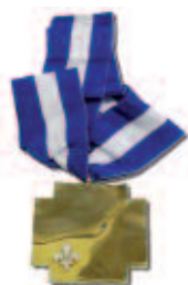
Insigne de l'Ordre national du Québec.

Il faut voir avec quelle émotion ces distinctions sont reçues par nos concitoyens pour comprendre à quel point l'institution de ces deux ordres est venue combler un besoin. Voir ses réussites reconnues par son propre gouvernement au nom de toute la nation crée certainement un sentiment de fierté incomparable. Mais, a-t-on le droit d'être fier ?