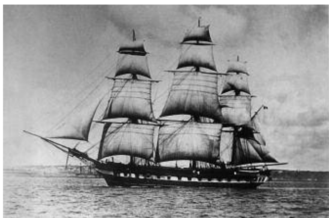
Le navire de guerre "La Capricieuse" mouilla dans le port de Québec en 1855. Ce faisant, il marqua officiellement le retour au Québec de la première unité militaire de la France depuis 1759.

Il est remarquable que cette décoration ait été remise à Taché en 1855, année de la venue du navire de guerre français La Capricieuse ; cette visite marquait, pour la première fois depuis la défaite de 1759, la présence officielle de la France à ce qui est aujourd'hui le Québec et le Canada. Comment ne pas voir en ces deux événements une volonté de la France de se rapprocher de son ancienne colonie après presque cent ans d'absence ? Pour sa part, l'ouverture d'un consulat à Québec par la France quelques années plus tard, soit en 1859, est une manifestation évidente de vouloir rétablir les liens.