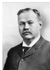
Louis-Honoré Fréchette (1839- 1908), poète, dramaturge, écrivain et politicien.

Contrairement à ce qu'on pourrait croire, les artistes et les écrivains sont peu nombreux parmi les récipiendaires de la Légion d'honneur, même pas une vingtaine. On en compte seulement quatre de 1855 à 1980 : l'écrivain Louis Fréchette, le sculpteur Louis-Philippe Hébert, dont certaines des statues ornent la façade du parlement de Québec, le maestro Wilfrid Pelletier qui s'est illustré au